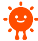
【平成27年度の価格表(調整価格1kWh当たり)】

今年度（平成27年度）の買取単価が発表されました。昨年度（平成26年度）に比べ、 10kw以上が27+税円/kwh(20年間)、10kw未満が33円/Kwh(10年間) と決定しました。特措法による3年余りのプレミアム期間は終了しましたが、10kw以上、10kw未満ともに、ほぼ想定内の買取価格だったのではないのでしょうか？太陽光発電も一つの区切り、普及期からやらなければいけないゼロエネルギー住宅【ZEH】を迎えました。